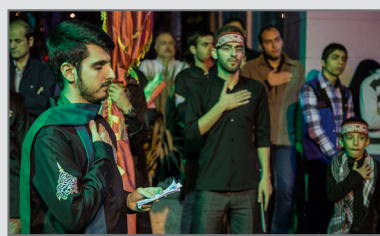
مراسم تعزیه خوانی