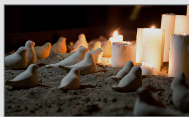
بخشی از فضاسازی راهرو