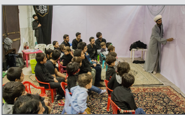
مهد کودک هیئت