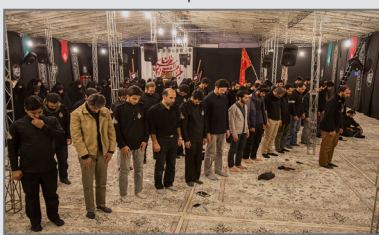
برپایی نماز جماعت قبل از برگزاری مراسم