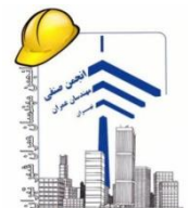
انجمن مهندسان عمران تهران