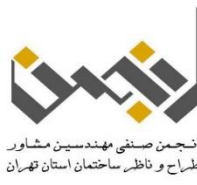
انجمن صنفی مهندسين مشاور طراح و ناظر ساختمان استان تهران