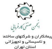
انجمن صنفی کارفرمایان پیمانکاران و شرکتهای ساختمانی و تاسیساتی و تجهیزاتی استان تهران