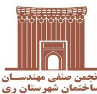
انجمن صنفی مهندسان ساختمان شهرستان ری