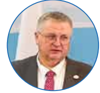
الکسی اورچوک معاون نخست وزیر فدراسیون روسیه