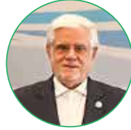
محمد رضا عارف معاون اول رئیس جمهوری اسلامی ایران