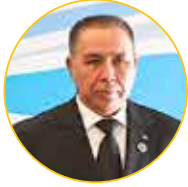
مراد گلدی میرادف معاون رئیس کابینه وزرا ترکمنستان