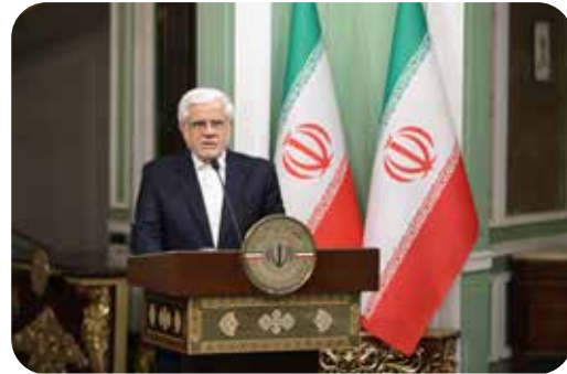
دکتر محمد رضا عارف معاون اول رئیس جمهوری اسلامی ایران