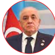
علی اسداف نخست وزیر جمهوری آذربایجان